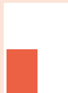
Rubrik 1/4-sida 88 x 120 mm 4-färg 8 800:-