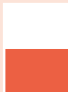
Rubrik 1/2-sida liggande 180 x 120 mm 4-färg 15 200:-