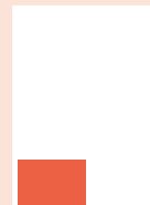
Rubrik 1/8-sida 88 x 59 mm 4-färg 4 500:-

Udda format: 38 kr/spaltmm (spaltbredd 42 mm)