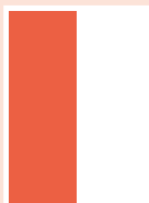
Rubrik 1/2-sida stående 88 x 244 mm 4-färg 15 200:-