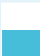
Rubrik 1/2-sida liggande 180 x 120 mm s/v 10 700:- 4-färg 14 800:-