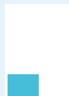
Rubrik 1/8-sida 88 x 59 mm s/v 3 600:- 4-färg 4 400:-

Udda format: 37 kr/spaltmm (spaltbredd 42 mm)