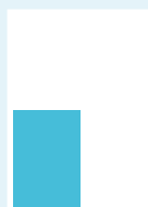
Rubrik 1/4-sida 88 x 120 mm s/v 6 300:- 4-färg 8 500:-