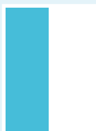
Rubrik 1/2-sida stående 88 x 244 mm s/v 10 700:- 4-färg 14 800:-